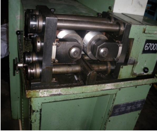
Begagnad gängrollmaskin RWT 12X , presskraft 12 ton, spindeldiam 54mm, svängbara spindlar, för korta och långa gänglängder(gängstänger). Verktysdiam max 150mm, verktysbredd max 80mm.