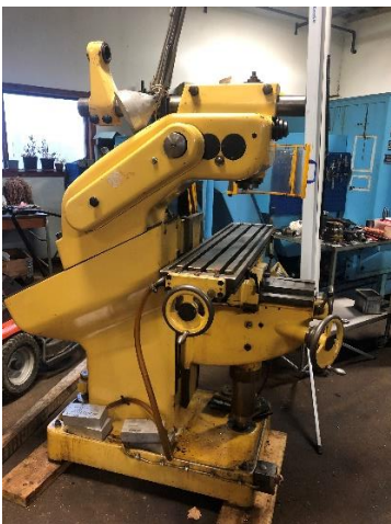
Beg.Fräsmaskin Abene VHF 3, fd skolmaskin i mkt gott skick.