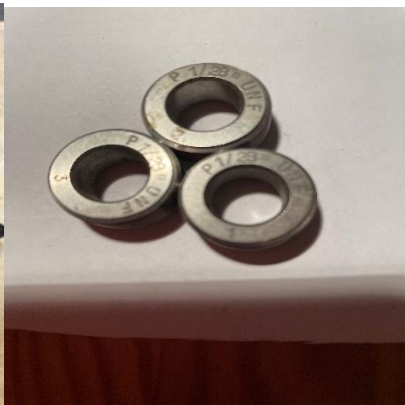
Beg.Gängrollhuvuden Fette Gängrullar till huvuden och maskiner